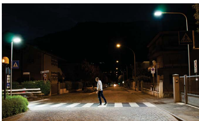
Applicazioni per Attraversamenti Pedonali

Rapporto Interdistanza / Altezza fino a 4 Abbagliamento contenuto