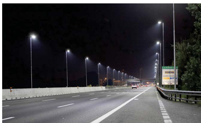
Applicazioni per Strade e Autostrade